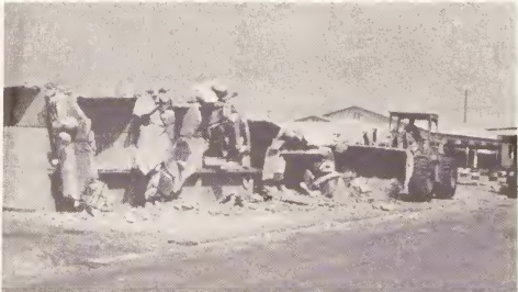
Ariba 18 di Maart ultimo a cuminsa cu e trabownan pa drecha e muelle na unda e mercada bieuw di fruta ta situa. Despues cu esaki ta cla den 9 luna na un costo di fls. 678.300 lo tin trabownan pa construcion di edificionan nobo y cobamento di lama eya na cu e mudcat. E ultimo dos trabownan aki lo costa mas o menos 1 milyon florin y ta completa e proyecto di waf chiquito.